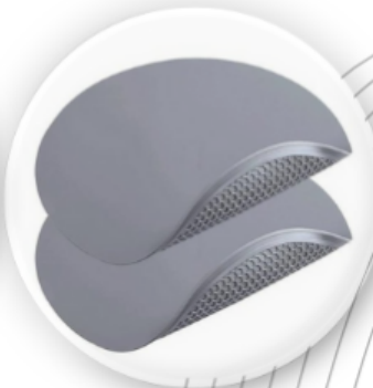
실리콘 매트 (원형)